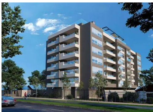
CARACTERÍSTICAS ESPACIOS COMUNES: